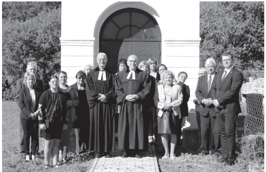
Az izsákfai evangélikus harangláb avatása.