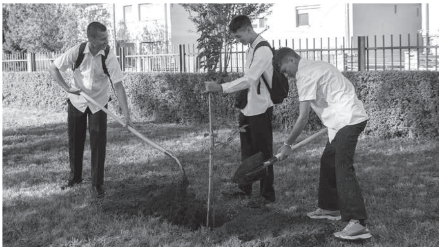
A Vas Vármegyei Szakképzési Centrum Eötvös Lóránd Szakképző Iskolájának új tanulói a hagyományokhoz híven fát ültettek az új tanév tiszteletére.