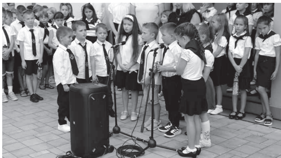
A Szent Benedek Katolikus Általános Iskola első osztályos tanulói verssel köszöntötték a 2025/26-os tanévet.