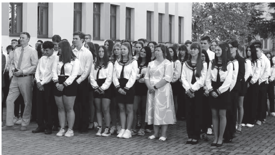
A Berzsényi Dániel Gimnázium diákjai is felsorakoztak az évnyitó ünnepségen.