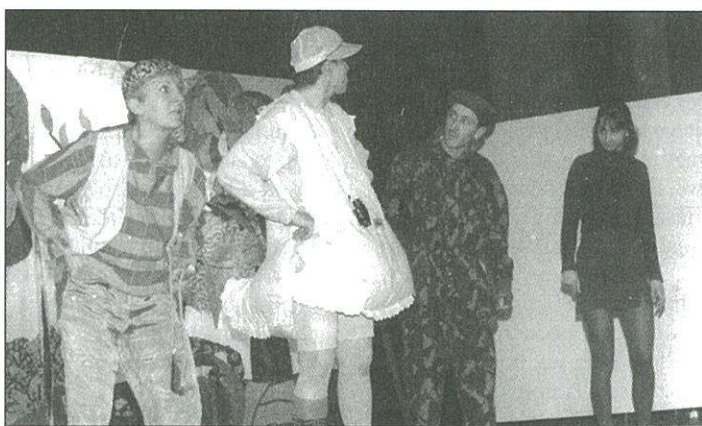
A Soltis színház mesejátéka óvodásoknak és kisiskolásoknak

Újra apróságok töltötték meg a KMK színháztermét január 24-e délelőttjén 10 órakor és délután