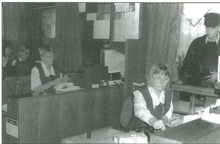
Számítógépes rendszerbe kapcsolódott be a posta

Nagy várakozás fogadta a technológiai újítást, melynek során az Integrált Posta Hálózatra kapcsolódott rá az 1. számú postahivatal január 23-án. Mint Zsuppán Géza, a Magyar Posta Rt. Soproni Igazgatóságának hálózatüzemeltetési igazgatóhelyettese az integrált rendszer bemutatásakor elmondta, a postai szolgáltatásoknál is az informatikatechnológia a fejlődés alapja, a XXI. században az ő munkaterületük is elképzelhetetlen számítógépes környezet nélkül. Az országos programba kapcsolódva a postahivatalban minden munkahelyre számítógépeket – pontosan tízennegy – ezekre postai prog-