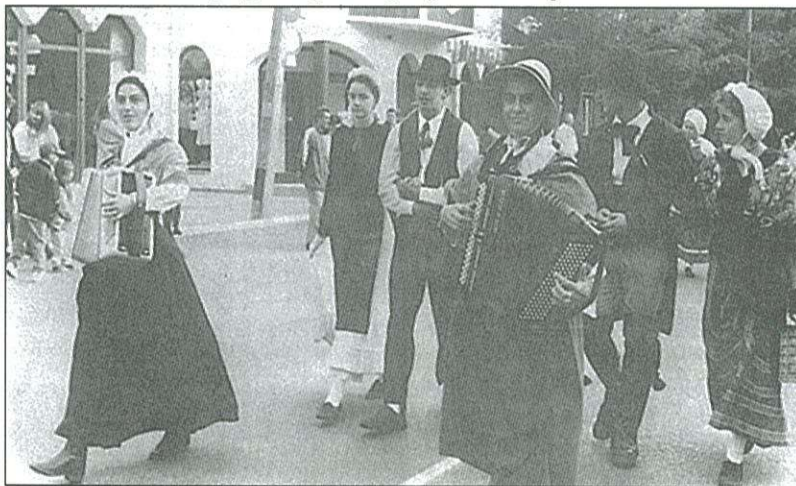
Messze még a szüreti mulatság...