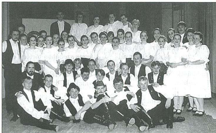
Továbbjutott a Kemenesaljai Néptáncgyűjtés is

A Kemenesaljai Művelődési Központ felhívására jelentkező versenyzők több kategóriában mutathatták meg tudásukat. Első alkalommal a színjátszók, a versmondók és a modern tánc kategóriából álló vetélkedőt. (Folytatás a 2. oldalon)