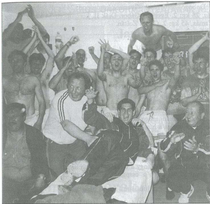
Amikor az öröm szét akarta vetni az öltöző falait...

Kívánjuk, hogy céljaikat valósítsák meg, és az NB II-ben is szerezenek sok szép felejthetetlen percet, jó szórakozást a Celldömölkön és Kemenesalján élő szurkolóknak. – tim –