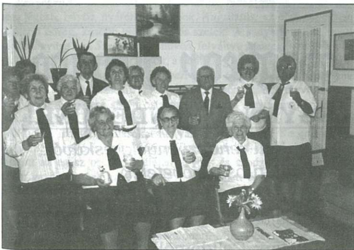
Csoportkép a dalkörrel