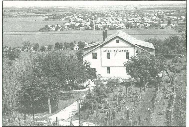
Pillantás a Krisztina csárdára

Most – örömeinkre – kezd kibontakozni valami. Az elmúlt években a kiránduló diákság még egy pohár vízhez sem jutott, mellékhelyiségek és más feltételek is hiányoztak. Most újra vendéglátók nyitogatják ajtaikat, csalogatják a vendégeket, s ez biztató. Talán több is ennél. A vállalkozók nem kis erőfeszítéseket tesznek a vendégfogadásért, s annak jobb minőségéért. A régi Turistaház felújítása és áttervezése Sághegy Fogadóvá, jelzi az új el-