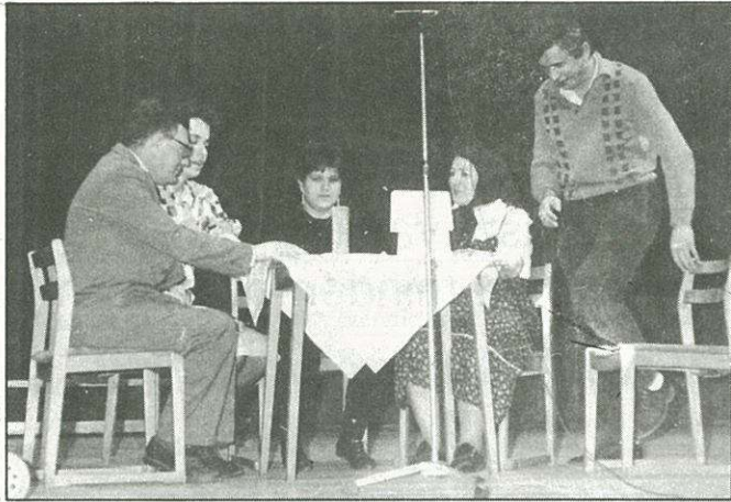
Pillanatkép a Részeges férj című jelenetből.