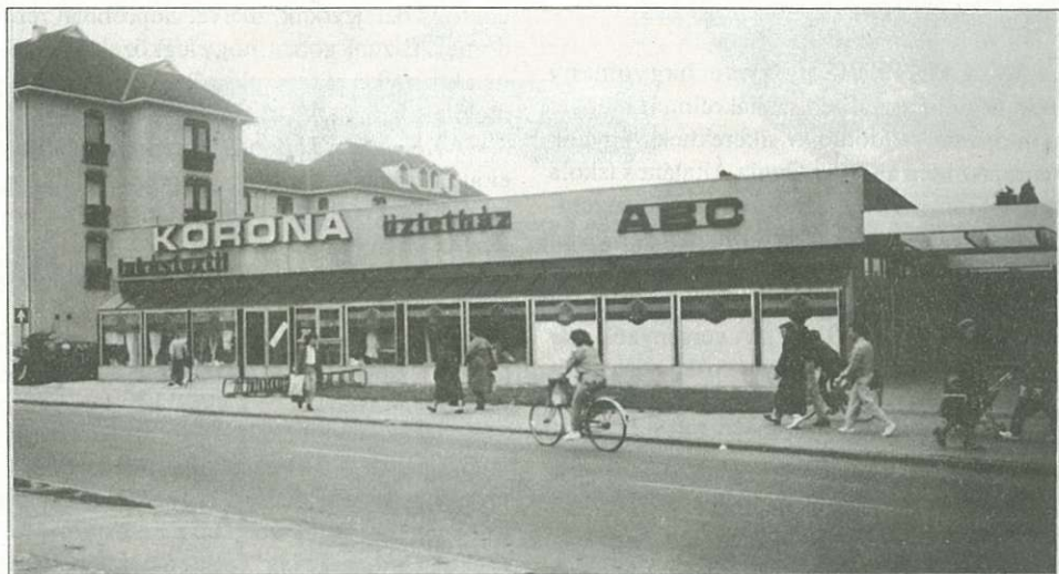
Celldömölk közkedvelt bevásárlóegysége, a Korona Üzletház kívülről...

Az élelmiszerszakmában a közvetlen termelői beszerzés és a különféle kereskedelmi szervezetekhez történő integrálódás piacérzékeny megvalósításával biztosítható a folya-