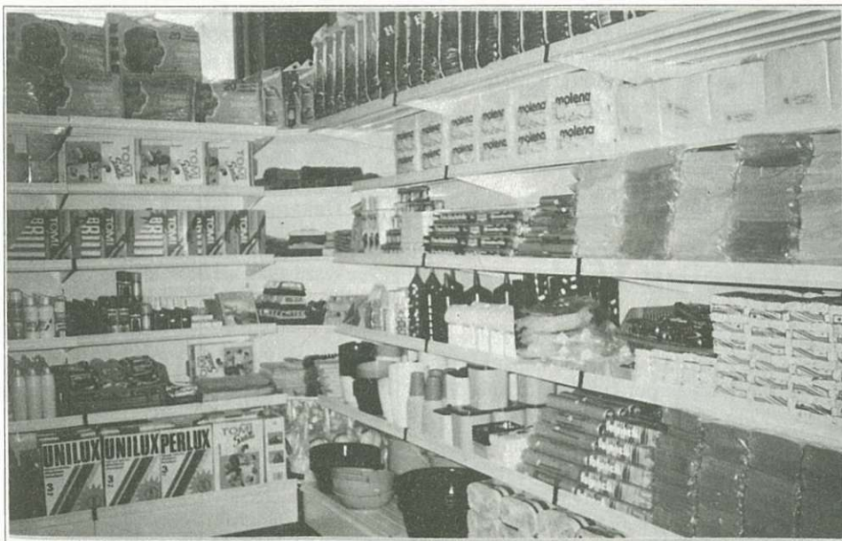
... és belülről.

Az elképzelések szerint – a lehetőségek figyelembevételével – az üzletrészek után 4% osztalék várható. Ez azt jelenti, hogy egy 30 ezer forintos üzletrészzel rendelkező tag 1200 forint visszatérítést kapna, amelyből a 10% jövedelemadó levonása után 1080 forint értékű vásárlási utalványban részesül. Vas megyében a 10 ÁFÉSZ fele fizet csak osztalékot és a celldömölki szövetkezet fizeti a legnagyobb mértékűt.