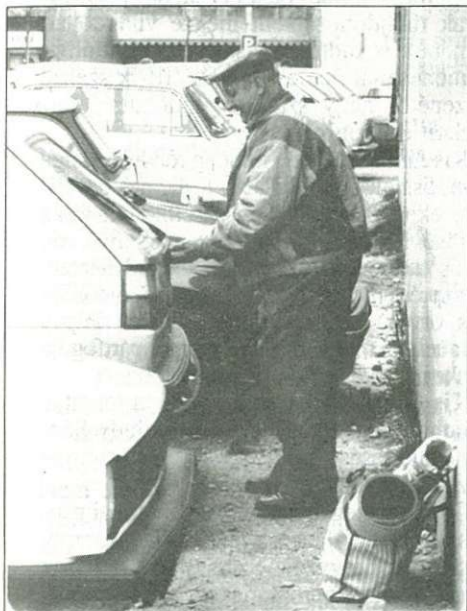
A technika ne szoríthasson bennünket a falhoz!

Az imént felsoroltak mellett vannak azonban tények, melyeket nem lehet megkerülni. Magyarországon állandóan növekszik a személygépkocsik száma, átlagéletkoruk szintén. Utjaink állapotát híven jellemzi – és tán