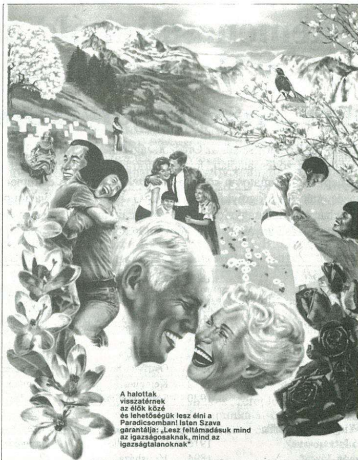
Részlet Az élet – hogyan jött létre? című kiadványból.

– A szervezeti felépítésünk az I. századi mintát követi. Szeretném hangsúlyozni, hogy a vezetőnk Jehova Isten, aki írott útmutatást adott – a Bibliát –, és Fia Jézus Krisztus, aki a gyakorlatban mutatta be, mit jelent az igaz Isten imádása és szolgálata. A jelenlegi körülmények között a szervezet törvényes működése érdekében a Vezető Testület és a világ számos pontján levő