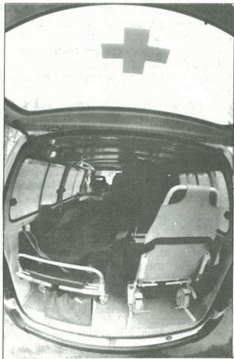
Inkább csak képről ismerjük a mentőautó belsejét!

– Visszatérve még az autók műszaki állapotára el kell mondanom, hogy gyakran találkozunk leromlott gépkocsikkal, vagy olyanokkal, melyeket a javítási költségek drágulása miatt otthon barkácsolt meg tulajdonosa. Az meg sem fordul sokak fejében, hogy a szakszerűtlen javítással nemcsak mások, de saját maguk életét is veszélybe sodorhatják. Külön kell szólni a gumiabroncsok állapotáról. Ezek minőségére jobban figyeltünk, hiszen a nyári, általában száraz útviszonyok nagyobb sebességre csábítanak, holott elhasznált, öreg gumiabroncsokkal jóval nagyobb a durrdefekt és az ebből adódó baleset veszélye. A megszigorított ellenőrzések során több rendszámtáblát és forgalmi