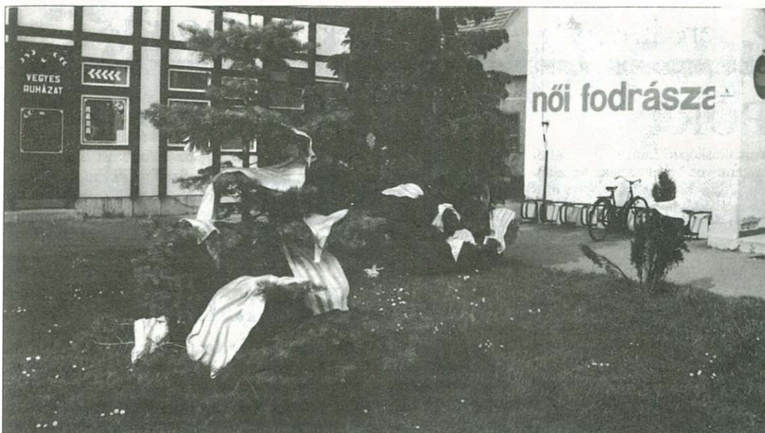
Azért talán mégsem a fenyőfákon a helye a száradó törülközőknek a város központjában...