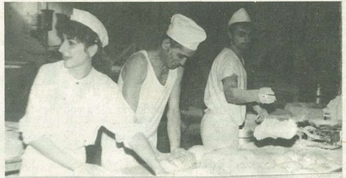
A kézi munka az üzemben ismét mindennapos.