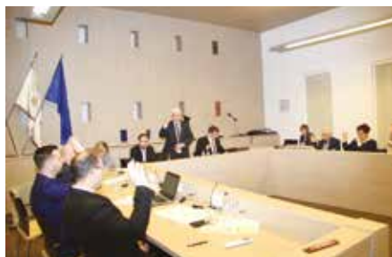
Celldömölk Város Önkormányzatának Képviselő-testülete munka közben

Az önkormányzat egyik legkiemelkedőbb feladata minden évben a költségvetés megalkotása. Hosszas egyeztetések után a testület február 12-ei ülésén fogadta el Celldömölk 2025-re vonatkozó pénzügyi tervét.