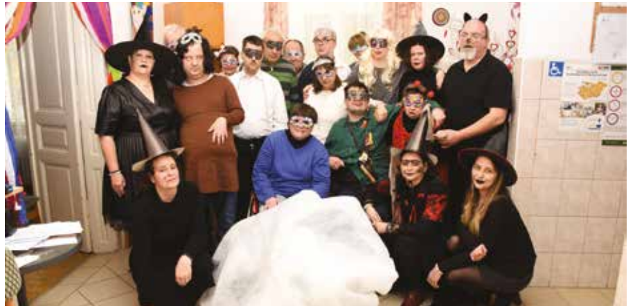
Népjóléti Szolgálat - Nappali Támogató Központ farsangja

Farsang. Egy ünnepkör, mely mindenkinek mást jelent. Valakinek a nagymama fánkját zamatos házi lekvárral tálalva, valakinek a tradíciók fontosságát, másoknak a vidámságot és a jókedvet, melyet bálokkal alapoznak meg. Ebben az időszakban jelmezt öltöztünk és néhány óráig azok lehetünk, akik csak akarunk. A vízkeresztől nagybőjtig tartó időszak hazánk egyik legtöbb hagyománnyal bíró ünnepkörét rejtí magában. Számtalan rendezvény, program kapcsolódik ehhez, melyekből Celldömölkön sincs hiány. Minden év februárjában farsangi han-