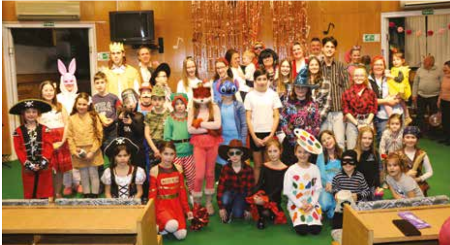
A Zeneiskola farsangi csoportképe

felkészültségükkel, szép muzsikájukkal örvendeztették meg a közönséget; másrészt pedig iskolánk nevelőtestülete, akik kicsit kibújva a hagyományos értelemben vett pedagógusi szerepkörből, fergeteges hangulatot