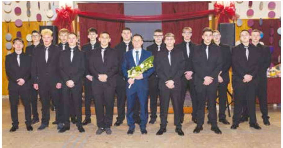
VVSZC Eötvös Loránd Szakképző Iskola 3/11.C osztálya