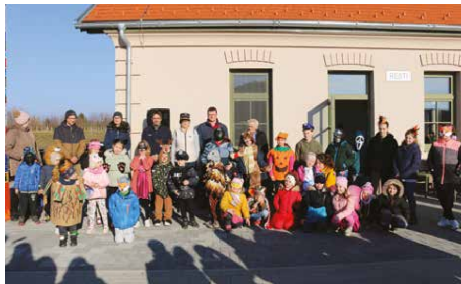
Nemcsak a gyerekek, hanem a szülők is vidám maskarát öltöttek.

Vasárnap délután különféle jelmezbe öltözött kicsik és nagyok lepték el a Vasparipa Játszóparkot, igazi farsangi mulatságot varázsolvá ott. A városi télbúcsúztató rendezvényt ez alkalommal a Kemenes Szolgáltató