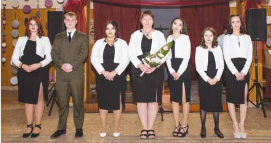
VVSZC Eötvös Loránd Szakképző Iskola 3/11.B osztálya

Szalagot kaptak a VVSZC Eötvös Loránd Szakképző Iskola végzős diákjai. A szalagavató rendezvényt és az azt követő bált február 14-én rendezték meg az intézmény aulájában.