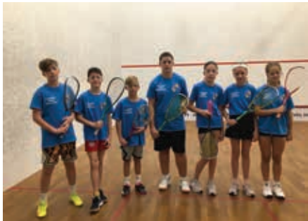
Hungarian Junior Open celldömölki résztvevői

Öt évvel ezelőtt adták át a Szent Benedek iskola új épületét a Koptik Odó utca sarkán, amelynek egyik különlegessége, hogy sportkomplexumában fallabdapálya is található. Ezt a létesítményt nemcsak a diákok, de a város lakói is élvezhetik, akik számára bérelhető a terem.