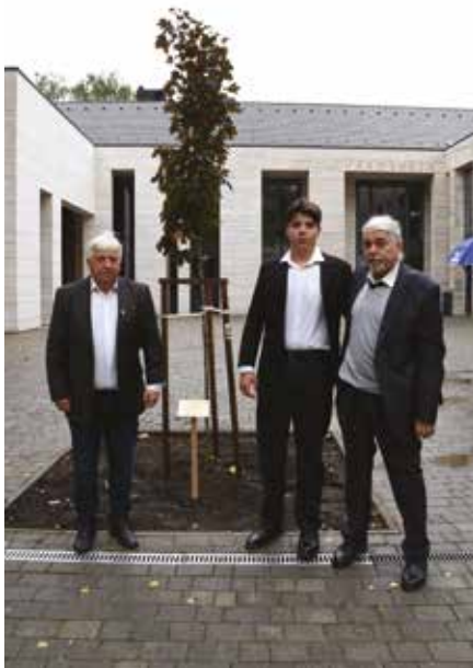
nehézipari minisztere, Celldömölk díszpolgára emlékére. Az eseményen