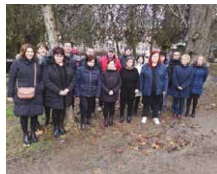
Kátyúban a közoktatás és a pedagógusok

»a kormány célja nem a probléma megoldása, hanem az annak hangot adók szankcionálása.