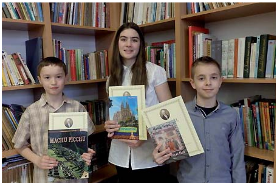
AZ 5-6. ÉVFOLYAM HELYEZETTEI