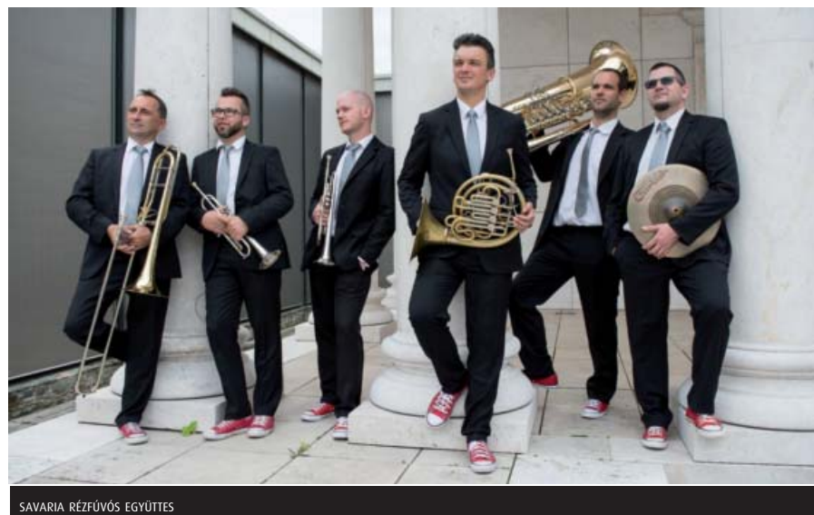
SAVARIA RÉZFÚVÓS EGYÜTTES