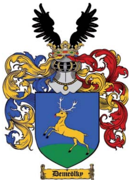
DÖMÖLKY CSALÁD CÍMERE