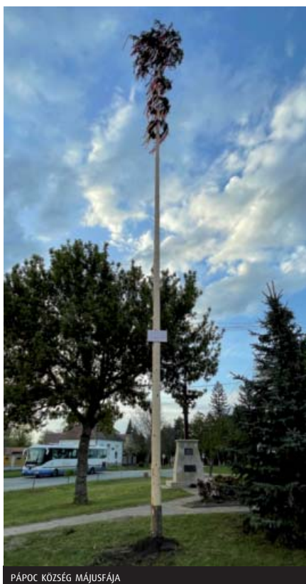
PÁPAC KÖZSÉG MÁJUSFÁJA

A felhívás egész Kemenesalját mozgósította; baráti közösségek, családok, egyesületek, óvodák és önkormányzatok is csatlakoztak a kezdeményezéshez. Celldömölkön kívül több település is részt vett a versenyben: Pápac, Köcsk, Ostffyasszonyfa, Vönöck, Szergény, Kenyeri, Kemenessömjén, Kemenesmagasi, Kemenesszentmárton, Mersevát és Nemeskeresztúr is benevezett a kiírásra. A Kmkk Celldömölk facebook oldalára 19 májusfát küldtek be, melyek közül közönségsvavazás útján dőlt el, hogy melyik „Kemenesalja legszebb májusfája”. Az intézmény online térben megvalósuló versenyei közül a fent említett program aktivitását bizonyítja, hogy az eddigi legnagyobb népszerűségnek örvendett a közösségi oldalon. A bejegyzés 55201 embert ért