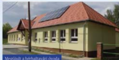
Megújult a béraltavári óvoda