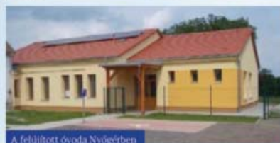
A felújított óvoda Nyögérben