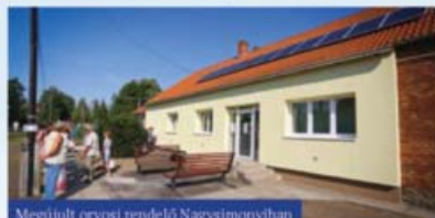
Megújult orvosi rendelő Nagysimonyiban