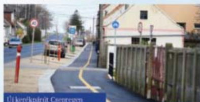
Új kerékpárút Csepregen