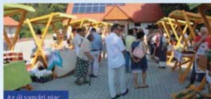
Az új vasvári piac