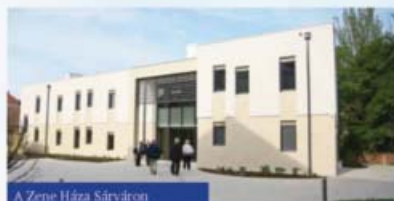
A Zene Háza Sárváron