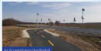
Az új vaszécenyi kerékpárút