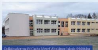
Csákványdoroszlói Csaba József Általános Iskola felújítása