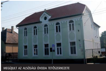
MEGÚJULT AZ ALSÓSÁGI ÓVODA TETŐSZERKEZETE

az iskola előtti terület felújítása új burkolatokkal és parkosítással, valamint a szemben lévő oldalon, az üzletek előtt egy új városközpont kialakítása. A kivitelezés heteken belül megkezdődik, befejezése tavaszra várható. Az elnyert pályázathoz az önkormányzat jelentős összeget biztosított, hogy a szerződéskötés minél hamarabb megtörtén-