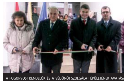
A FOGORVOSI RENDELŐK ÉS A VÉDŐNŐI SZOLGÁLAT ÉPÜLETÉNEK AVATÁSA

adatokat tűztünk ki célul, és pályázatainkhoz meg is kaptuk a támogatásokat. A Vulkán Gyógy- és Élmenyfürdő körzeti fürdővé vált, ami a fürdők sorában egy nagyon nagy előrelépést jelent, emellett gyógyhelyé nyilvánították a fürdő körül kijelölt területet, ezzel több lehetőség is megillet most és a későbbiekben is bennünket a pályázatok közül, amelyeket kizárólag a gyógyhelyek számára írtak ki. Ennek keretén belül nyújtottunk be pályázatot, amelyben a Vulkánpark szabad területére terveztünk kőparkot, mászófalat, az épület konferenciateremmel és kávézóval való bővítését, valamint egy igazi kisgyermeknek való látványosságot, az egész parkon körbe futó kisvasút megépítését. Ennek a pályázatnak a Ság hegy fejlesztése is része. Bizom benne, hogy az Őrségi Nemzeti Parkkal közösen megfelelő állapotba tudjuk hozni a Ság hegyet. 220 millió forint összegű támogatást nyertünk a „Vas-