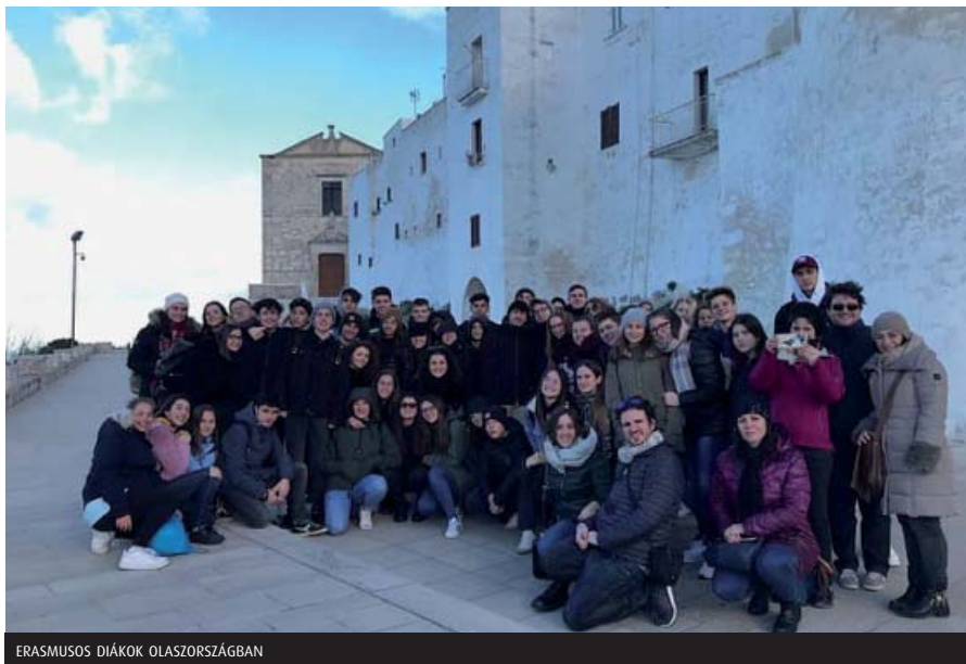
ERASMUSOS DIÁKOK OLASZORSZÁGBAN

A második projektalkalmazóra 2019 májusában Németországban, a projekt koordinátor iskolájában, a Wertingeni Gim-