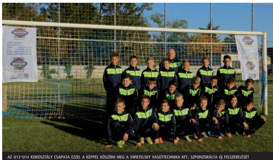
AZ U13-U14 KOROSZTÁLY CSAPATA EZZEL A KÉPPEL KÖSZÖNI MEG A SWIETELSKY VASÚTECHNIKA KFT. SZPONSZORÁLTÁ ÚJ FELSZERELÉSÉT