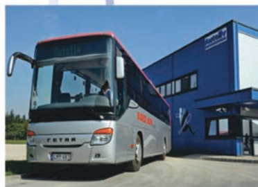
AUTOLIV Kft. Sopronkövesd

A munkába járást ingyenes Autoliv buszjáratokkal biztosítjuk.