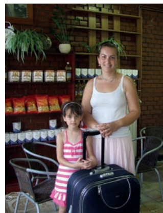
AKIK ÖRÖMMEL ADOMÁNYOZNAK

szén augusztus 1-jétől minden munkanapon délelőtt 9-től este 6 óráig mindezt nyújtják az Együtt Celldömölk Városért Egyesület tagjai. Sőt, mivel nyakunkon az iskolakezdés, jó minőségű ruhák, tanszerek várják új gazdájukat. Kevés pénzből, kisnyugdíjból élők bejelenthetik itt igényüket tűzifára, de akad egy-egy csomag tartós élelmiszer azok számára is, akiknek szükségük van rá.