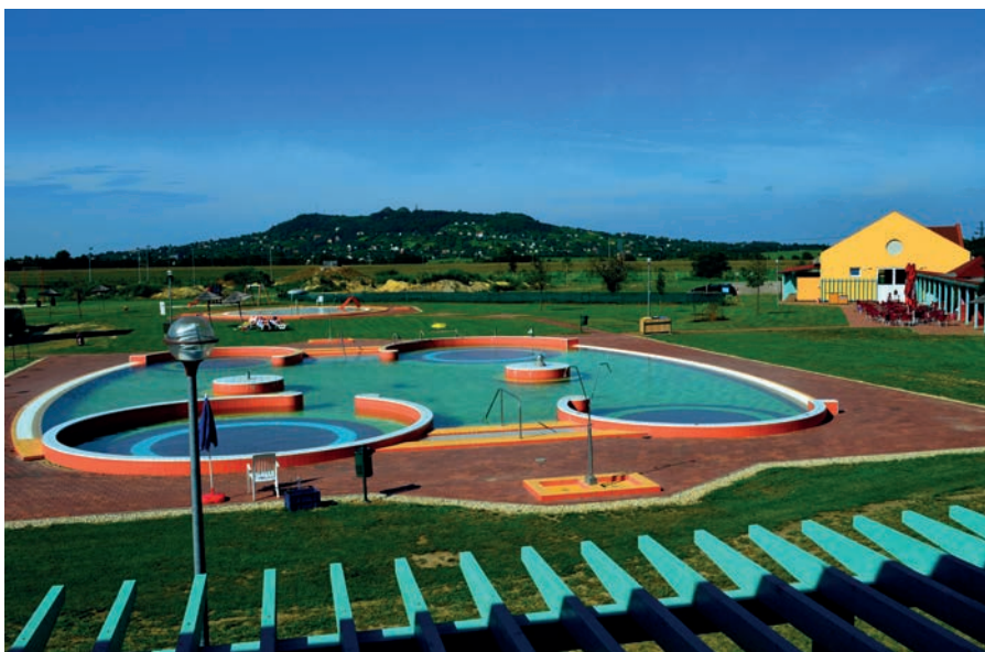
A PIHENŐTÉRBŐL ELÉNK TÁRULÓ PANORÁMA