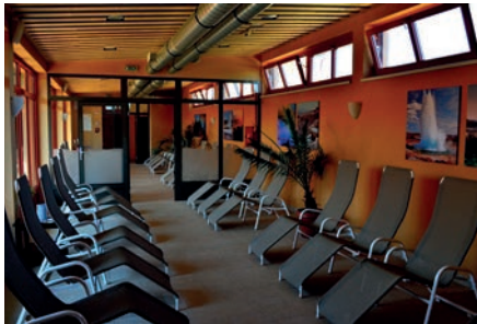
A PIHENŐTÉRBE IGÉNY SZERINT TEÁZÁSRA IS LESZ LEHETŐSÉG

Augusztus 5-én megnyílt a Vulkán Gyógy- és Élményfürdő szauna-világa. A hivatalos átadó után a megnyitó résztvevői közösen járták be a fürdő legújabb komplexumát.