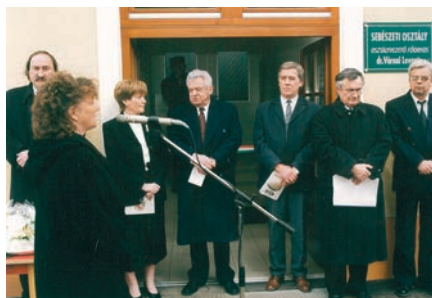
A FELJÚJÍTOTT KEMENESALJAI EGYESÍTETT KÓRHÁZ AVATÁSA

– 1990-ben három párt – az MSZP, az MDF és a Kereszténydemokrata Néppárt – megkeresett, legyek a polgármester-jelöltjük. Tisztelettel megköszöntem, de nem vállaltam el. Képviselő szerettem volna lenni, de az 1990-es önkormányzati választásokon egy szűk kör csekély szavazatkülönbséggel megbuktatott. A munkát tovább folytatva 1991-ben pályázat útján kerül-