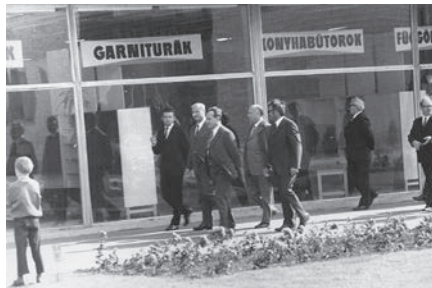
LOSONCZI PÁL LÁTOGATÁSÁKOR

ték a közműfejlesztési hozzájárulásokból (1984-ben egy köbméter gáz ára 2,60 forint, a közműfejlesztési hozzájárulás 20 ezer forint volt). Ezt a közműfejlesztési hozzájárulást 520 millió forint összegben a város visszakapta az Égáz privatizálása során. Ez is a tanács hagyatéka volt az önkormányzatnak. A Minisztertanácstól a Kiváló Munkáért kitüntetését három alkalommal kaptam meg (1984, 1987, 1989 években). Az Elnöki Tanács a Munka Érdemrend Bronz Fokozatával tüntetett ki 1986-ban.