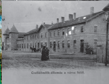
Czeldömölk-állomás a város felől.