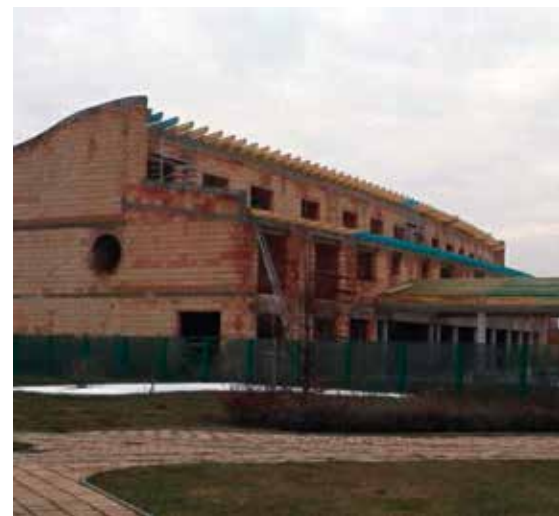
AZ ÉPÜLŐ SZÁLLODÁTÓL REMÉLIK A NAGYOBB VENDÉGSZÁMOT

– Ausztriában működik egy Vulkanland nevű tájegység, ahol – Celldömölkhöz hasonlóan – szintén a vulkánosságra építik az idegenforgalmat. A régió működé-