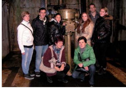
BAD REICHHALL, ALTE SALINE – GEORG VON REICHENBACH EMELEGÉPÉNÉL

– Minden ország a hozzá kötődő kereskedelmi útvonalat, annak egy-egy jellemző részét járja körbe. Mi a Borostyánkő út jelentőségét szeretnénk bemutatni a projektben szereplő többi résztvevőnek. Vállaltuk ugyanis, hogy a projekt során iskolánk diákjai és pedagógusai előadásokat tartanak, kutatómunkát végeznek, kirándulásokat és kiállításokat szerveznek a témához kapcsolódóan. Az eredményekről az ún. projekttalálkozókon számolnak be a résztvevők. Ezek a találkozók lehetőséget nyílik a tapasztalatszerzésre, az előrehaladás értékelésére, a német nyelv gyakorlására, egy másik ország kultúrájának, szokásainak megismerésére. A projekt több tantárgyhoz kapcsolódik: a történelemhez, az idegen nyelvhez, a földünk és környezetünkhöz, az informatikához, a magyar nyelv és irodalomhoz, valamint a szakmai tantárgyakhoz. Fontosnak tartjuk, hogy iskolánk minél több tanulója bekapcsolódjon a különböző tanórai és tanórán kívüli tevékenységekbe, melyekbe szeretnénk a