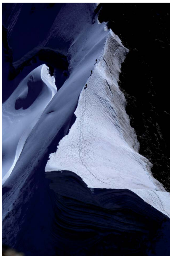
A DIJNYERTES FOTO

nek lényege, hogy a világ legelhagyatottabb és legszebb szikláin pár hónap le-