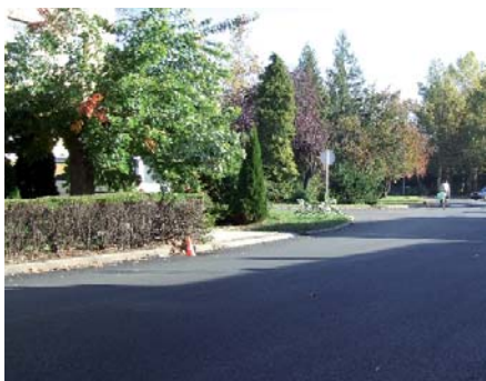
A DR. SZOMRACY UTCA FELÚJÍTOTT SZAKASZA

Új aszfaltburkolatot kapott a dr. Szomraky Zoltán utca. A felújítási munkálatok október 24–26. között zajlottak, ez alatt az idő alatt forgalomszabályozás volt érvényben az útszakaszon. Időközben – a városkép szempontjából meghatározó – K&H Bank épületének korszerűsítése is elkezdődött.