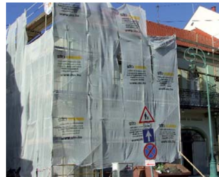
A MEGÚJULÁS ALATT ÁLLÓ ÉPÜLET