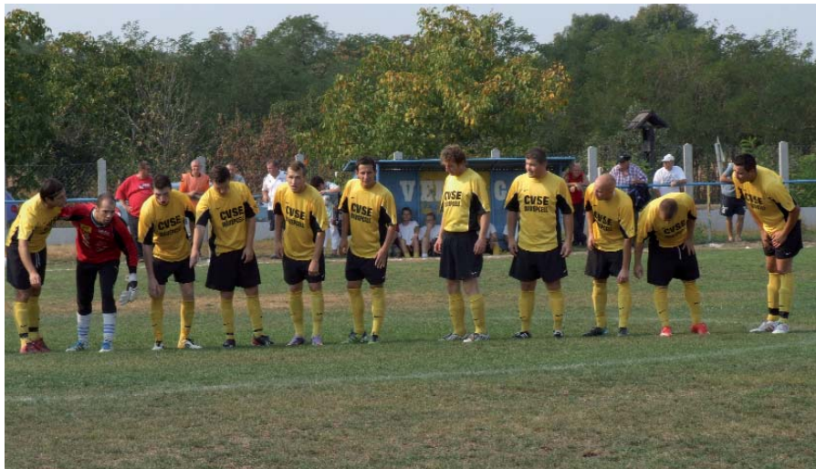
ÖSSZHANG NÉLKÜL NEM MEGY