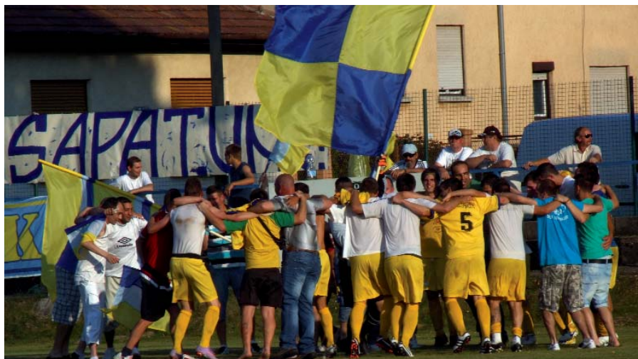
GYŐZELMI MÁMORBAN A CVSE FELNŐTT FOCI CSAPATA