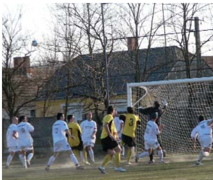
A GÓL ELŐTTI PILLANAT