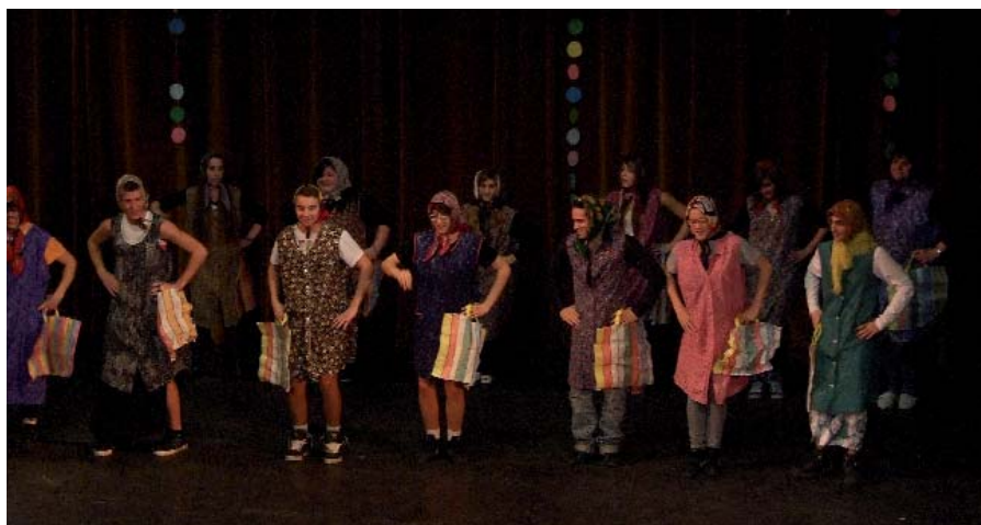
NAGY SIKERT ARATOTT A 8. D OSZTÁLYOSOK LIDI NÉNJE

számra készített táncos előadásával varázsolt jó hangulatot. A látványos show-műsor zárásaként a cirkusz világába nyújtott betekintést előadásával a Tücsök Bábcsoport. A felső tagozatosok február 15-én álltak színpadra, hogy bemutassák farsangi összeállításukat. Az 5., 6., 7., 8. osztály diáksága Ki mit tud? keretében zenével, tánccal, tréfás jelenetekkel, múlt- és szellemidézéssel színesítette a farsang jegyében zajló programot. A műsorok sora a Napoleon Boulevard együttes Legyetek jók, ha tudtok! című népszerű dalával indult, majd az ötödik évfolyam bemutatói következtek, melyek közt tánc, Micimackó dal-átírat, és magyar költők verseiből válogatott előadás egyaránt szerepelt. A hatodikosok vidám jelenetükkel az egykori laktanyaéletet eleve-nítették fel, majd gonosz boszorkák, szellemidézők és vadnyugati hősök lepték el a színpadot különféle műsor-számok keretében. A farsangi műsor további részében még a diákok táncos-