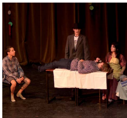
A 8. A JELENETET ADOTT ELŐ AZ INDUL A BAKTERHÁZBÓL

többek között macska-egér játékot, a Karib-tenger kalózáinak színpadi csatáját és a pingvinek sarkvidéki táncát is láthatták az alsó tagozatosok előad-