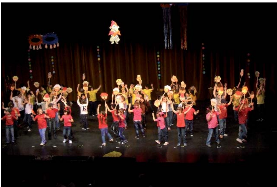
AZ ELSŐSÖK SZÍNES FARSANGI KAVALKÁDJA