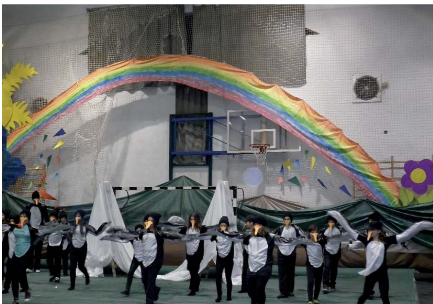
LÁTVÁNYOS PRODUKCIÓT ADTAK ELŐ A TAGISKOLA DIÁKJAI PINGVIN-TÁNCUKKAL

sában. A felsőbb évfolyamok osztályai táncoreográfiákkal színesítették az estét, a végzősök pedig az iskolában töltött évekre emlékeztek vissza nosztal-