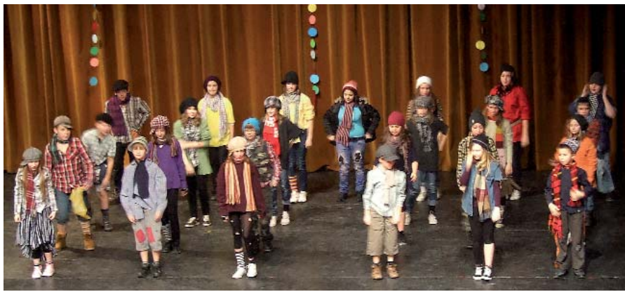
VÁLAHOL EURÓPÁBAN – AZ 5. OSZTÁLYOSOK SZÍNVRONALAS ELŐADÁSA

mozgásos produkciói szórakoztatták a közönséget, ezenkívül Megasztár-párodíával, tanár-diák aranyköpésekből összeállított műsor számmal léptek színpadra a diákok, de az Indul a bakterház is megelevenedett a színpadon. A műsor-kavalkádban az iskola énekkara, és kötélugró csoportja is szerepet kapott, a több mint kétórás program utolsó részében pedig két végzős osztály jó hangulatú táncos előadása volt porondon. Zárószámként a Tücsök Bábcsoport mutatta be Békatánc című UV-technikás darabját.