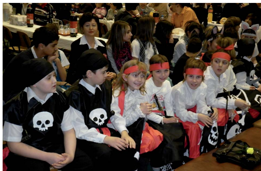
IZGATOTTAN VÁRNAK SORUKRA A KARIB-TENGER KALÓZAI

A Városi Általános Iskola Alsósági Tagiskolája február 11-én rendezte meg hagyományos SZM-bálját. A farsangi műsor az idei évben a szivárvány jegyében zajlott, az iskola diákjai a színpaletta ezer arcát keltették életre a színpadon, vidámságot és melegséget lopva a szürke téli mindennapokba. A maszkabálok elengedhetetlen kellékei, a mókás jelmezek idén sem hiányoztak az iskolások produkcióiból, a nézők