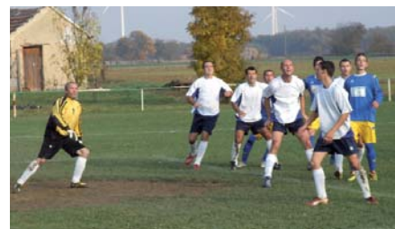
SZEMEKET A LABDÁRA! JELENET A PECÖL-CELLDÖMÖLK MECCSRŐL