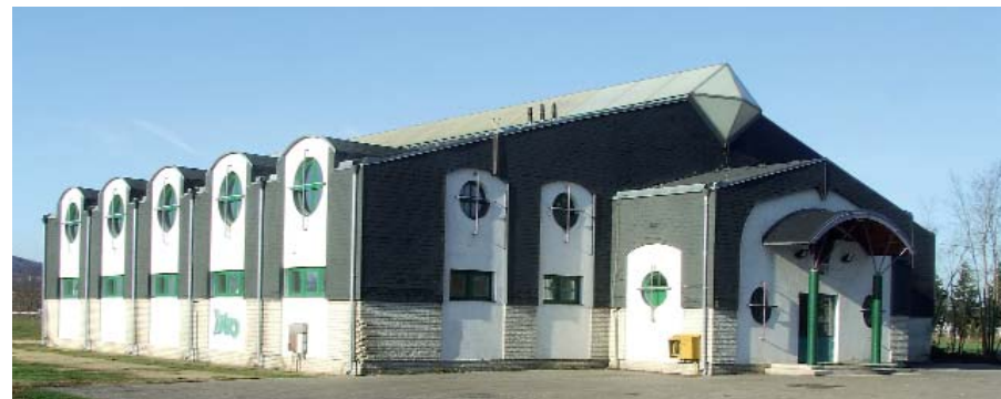
JANUÁRTÓL AZ ALSÓSÁGI SPORTCSARNOK ÜZEMELTETÉSÉT IS A VÁROSGONDNOKSÁG VÉGI