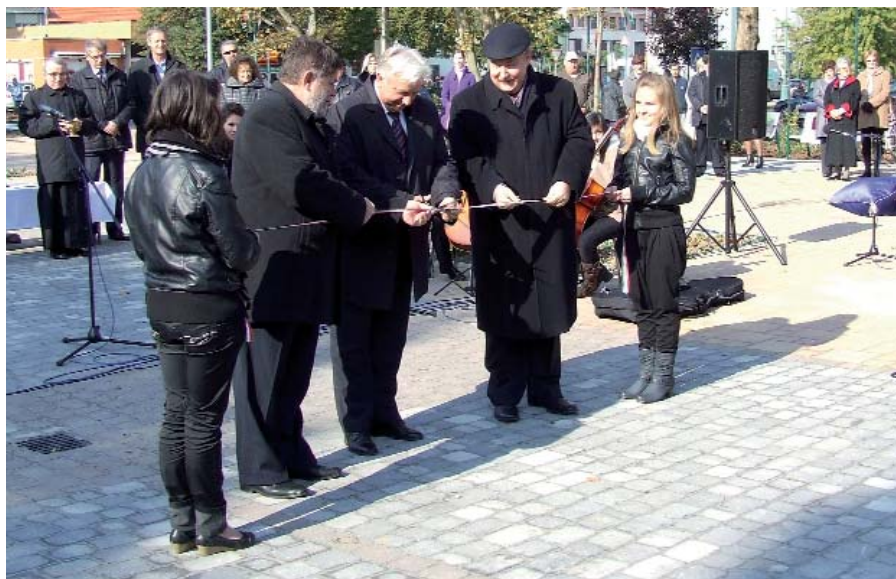
A TÉRAVATÓ EGYIK ÜNNEPÉLYES PILLANATA

Délután könnyed pódiumműsorral szórakoztatták nemzetközi és helyi művészek a tere kilátogató közönséget. A zenés műsor-összeállításban elsőként a Mirage Salon Quartett együttes lépett a nagyrédemű elé. A zenekar a komolyzene és a könnyűzene közötti arany középutat megcélözva, igényes muzsikával szórakoztatta a hallgatóságot. A lány dallamokat követően egyik testvérvárosunk képviselőjében, a seramazzoni Amarcord társulat kalauzol-