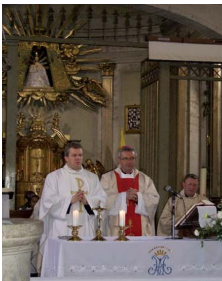
A TÉRSZENTELÉS HÁLAADÓ ISTENTISZTELETTEL KEZDŐDÖTT