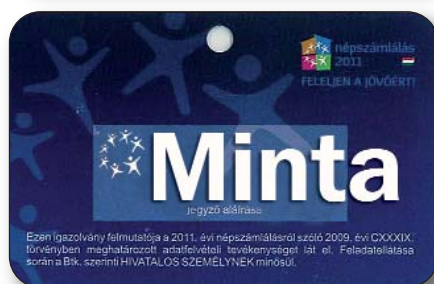
A SZÁMLÁLÓBIZTOS KÖTELES FELMUTATNI IGAZOLVÁNYÁT