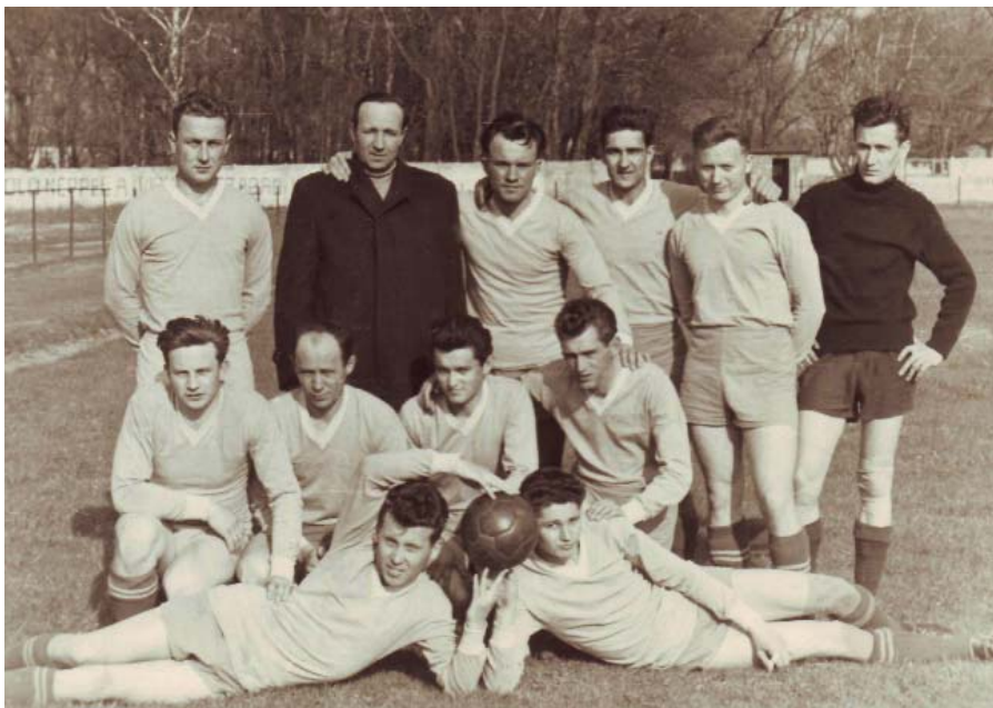
CVSE-VASVÁR 6 : 1