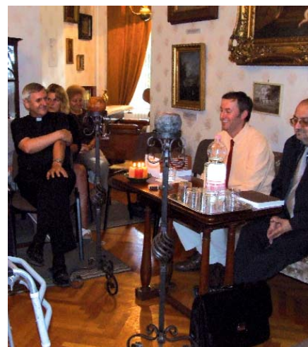
A KÖNYV BEMUTATÓJA A TÁPIÓSZELEI MÚZEUMBAN

– Igen, egyértelműen. Az általam meginterjúvolt diákok egyöntetű véleménye alapján állíthatom, hogy az akkor kialakult közösségek a mai napig meghatározó szerepet töltenek be az egykori tanuló életében. Ezt az a könyvbemutató is megerősítette, amelyre nemrégiben a tápiószelei Blaskovich Múzeumban került sor. A rendezvényre nagy számban jöttek el hajdani polgáris diákok, akik esetenként 55-60 évvel ezelőtt látták egymást utoljára, de akik ennek ellenére régi barátokként üdvözölték egymást... Különösen jóleső volt a tudat, hogy ezeket az embereket összehozhattuk az Isteni Szeretet Leányai Társulatában jelenleg működő nővérekkel. Meghatóan szeretetteljes, ugyanakkor oldott hangulatban folyt a társalgás régi, közös ismerősökről, diáktársakról, szerzetesanárokról. Szinte észrevétlenül repültek az órák, s az az este mostantól életem egyik legmeghatározóbb élményei közé tartozik. Tulajdonképpen ez adta az ötletet ahhoz, hogy itthon, Celldömölkön is létrehozunk egy ilyen találkozót. S külön örömmel tölt el a tudat, hogy ennyi év után, ha csak egyetlen hétvégére is, de „visszavarázsolhatjuk” majd Kemenes-