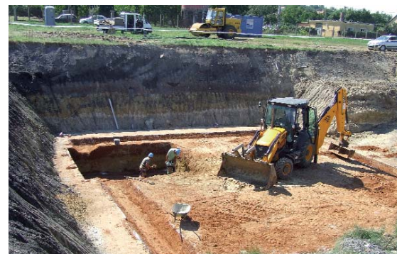
JAVÁBAN FOLYNAK A MUNKÁLATOK A SÁG HEGY LÁBÁNÁL