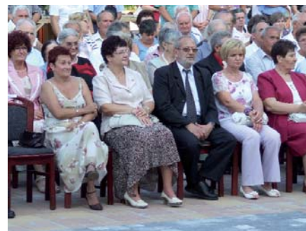
A KITÜNTETETTEK EGY CSOPORTJA