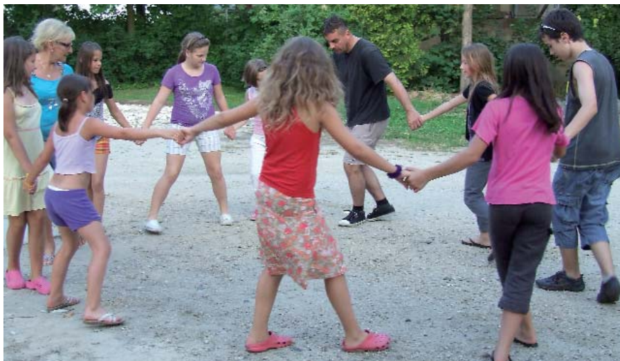
A NÉPTÁNCANULÁS IS A MOZGÁS ÖRÖMÉT SZABADÍTOTTA FEL A GYEREKEKBEN

Az Együtt Celldömölk Városért Egyesület első alkalommal szervezett életmódtábort a Társadalmi Megújulás Operatív Program „ Egészségre nevelő és szemléletformáló életmódprogramok ” című projektjének keretében július elején. A Vasvirág Hotelben helyet