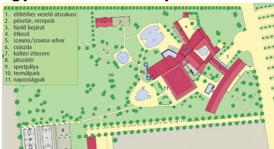
SAUNAPARK, ÓRIÁSCSÚSZDA, SPORTPÁLYÁK IS RÉSZEI A FEJLESZTÉSNEK

Cellődmölk Város Képviselő-testülete 2011. június 22-én tartotta rendkívüli ülését, melyen mind a tizenegy döntéshozó jelen volt. Az ülés központi témája a Vulkán fürdő üzemeltetése illetve fejlesztése volt. Köztudomású, hogy június 9-én egy rendkívüli képviselő-testületi ülésen már tárgyaltak a témáról, de akkor nem született döntés sem a fürdő fejlesztését, sem az üzemeltetését illetően. A megismételt ülést azért volt indokolt összehívni két héten belül, mert az infrastrukturális bővítést vállaló JUFA Ungarn Kft. egy többszáz millió forintos pályázatot nyújtott be a Regionális Fejlesztési tanácshoz, melynek módosítását július 3-ig le kell adnia, különben elveszik a már megnyert 340 millió forint, amelyet szálloda illetve camping