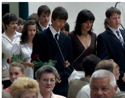
AZ ALSÓSÁGI TAGISKOLA NYOLCADIKOSAINAK BALLAGÁSA

A Városi Általános Iskola alsósági tagiskolájában is a nyolcadikosok búcsúztatásával vette kezdetét a ballagással egybekötött tanévváró ünnepély.