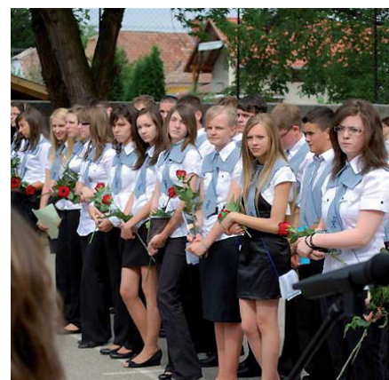
A SZENT BENEDEKBEN IS FELSORAKOZTAK A BALLAGÓK

Minden diák álma egész tanévben, hogy eljőjön az a pillanat, amikor végre az igazgató kimondja az áhított mondatot: „a 2010/2011-es tanévet lezárom.” Már a június 15-e esti szerenád is, de a szombaton délelőtt 9 órakor kezdődő ballagáson azonban néhány nyolcadik osztályos leány könyvező szeméből azt lehetett kiolvasni, hogy ők még szívesen maradnának, és fájó szívvel hagyják itt iskolájukat.