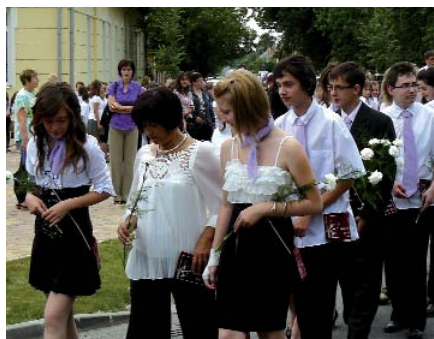
A BALLAGÓK VÉGIKVONULTAK A SZÉCHENYI UTCÁN

ket. A ballagási igazgatói beszéd elhangzása után a hagyományoknak megfelelően a nyolcadikosok léggömbjei repültek a levegőbe.