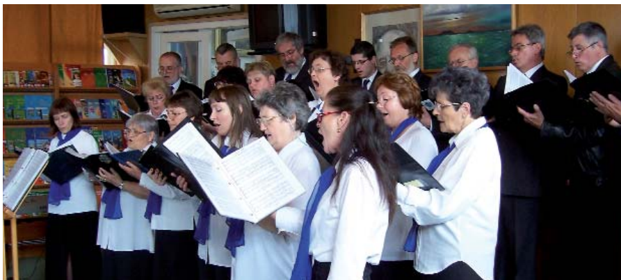
IDÉN A KESZTHELYI VEGYESKAR IS SZEREPELT A FESZTIVÁLON