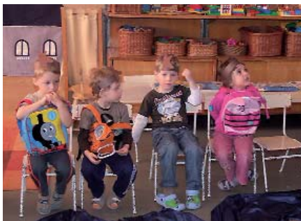
ÚTRA KÉSZEN A NAGY UTAZÁSRA AZ OVISOK

A Föld napja tiszteletére az óvónéni hat földrészen keresztül kísérték el a gyermekeket egy Föld körüli utazásra, nagyon szemléletesen bemutatva egy-egy földrész legfőbb jellemzőit, szokásait, természeti és kulturális értékeit. A nagy kaland az óvoda udvarán kezdődött, ahol egy „látó domb” avatással indították útra a kis lurkókat. A kontinensek legfőbb jellemzőivel berendezett csoportszobákban a pedagógusok idegenvezetőként mutatták be „saját” földrészüket. A csoportok forgó rendszerben, tízpercenként váltották egymást. A hangulatosan berendezett termek magával ragadták a gyermekeket, s bizton állíthatom, hogy a felnőtteket is. Az utazás befejeztével a picik közös foglalkozáson a kiindulópont, a látó domb mellett beszéltek meg élményeiket, mondtak verseket, játszottak és