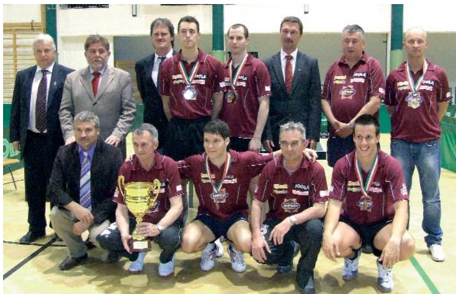
A GYŐZTES CSAPAT AZ EDZŐKKEL ÉS TÁMOGATÓKKAL

Celldömölki VSE-Swietelsky-Wewalka – PTE-PEAC Pécs 6:4. - Celldömölk, asztalitenisz Extraliga-mérkőzés, vezette: Szentgyörgyi, Vavrek.