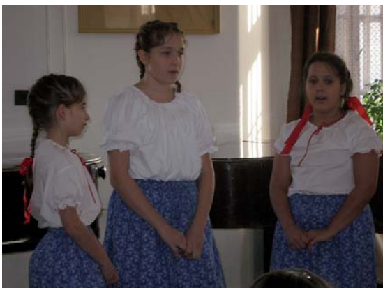
JÓL SZEREPELTEK A PALÁNTÁK IS

A celldömölki Ádám Jenő Zeneiskola Alapfokú Művészetoktatási Intézmény idén is megrendezte a több éves múltra visszatekintő népdaléneklési versenyt névadója, Ádám Jenő születésének évfordulója alkalmából. Az 1989-es tanév óta megrendezésre kerülő verseny 2010-ben december 10-én várta a dalos kedvű diákokat, akik Sárvártól Balatonalmádiig a környező településekről érkeztek, összesen ötvenöten. Az iskola