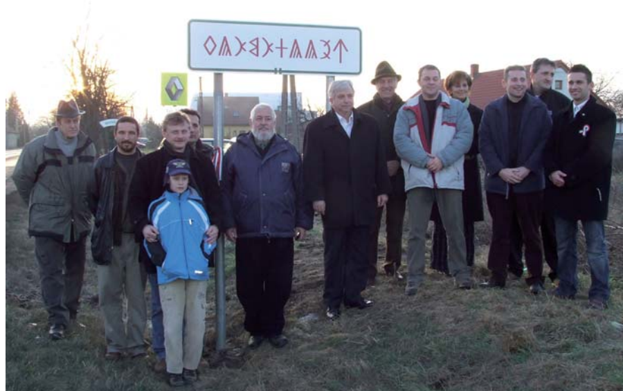
VÁROSUNK AZ 1. SORSZÁMÚ TÁBLÁT KAPTA

A székely-magyar rovásírás a székelység és magyarság írása volt a latin írás meghonosodása előtt. A „rovás” kifejezés eszköze a fa volt, eleink erre rőt-ták jelentős közlendőjüket. S minthogy a fa egy idő után elkorhad, nagyon kevés tárgyi emlékekkel rendelkezünk. A rovásírásnak minden korban akadtak kutatói, így ma is – sőt, ezen túlmutatva megpróbálják ezt az írásmódot egy kicsit visszacsempészni a mindennapokba. Ennek egyik megvalósulása a rovásos helynévtábla.