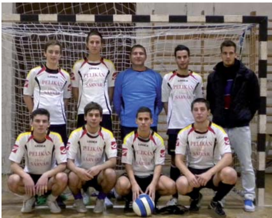
MÉLTÁN KERÜLT A DOBOGÓ LEGFELSŐ FOKÁRA A GULLII-VER

Immáron a XXII. Szilveszter Kupa teremlabdarúgó-tornát rendezte meg december 27–30. között a városi sportcsarnokban a VulkánSport Egyesület.