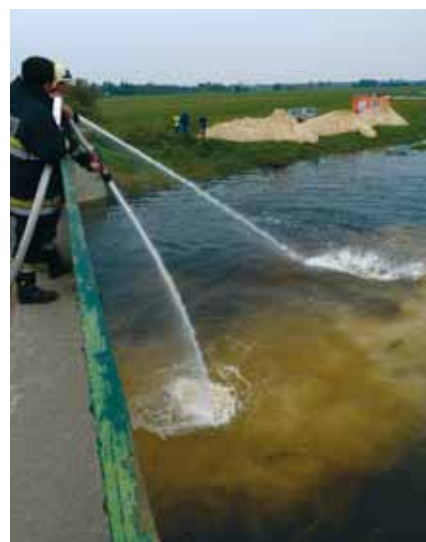
A KATASZTRÓFAVÉDELMESEK ÉS A TÚZOLTÓK IGYEKEZNEK KIOLTANI A VÖRÖSISZAP-SZENNYEZÉST