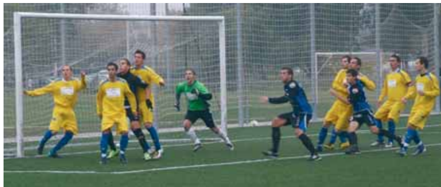
A VÉDEKEZÉSRE ÖSSZPONTOSÍTOTTAK A SÁRGA MEZES CELLIK A PÁPA ELLENI MECCSEN

időpontban, csütörtökön rendeztek meg. Gyönyörű idő (a többiek majd november végén pótolhatják a fordulót) fogadta a csapatokat, akik úgy döntöttek, ennyi jó élmény legyen is elég a nézőknek. Mindkét csapat hasonló fellegásban játszott, a Hévíz azért játszott óvatosan, mert eddigi három idegenbeli meccsén még nem nyert egyszer sem, a Cell meg azért,