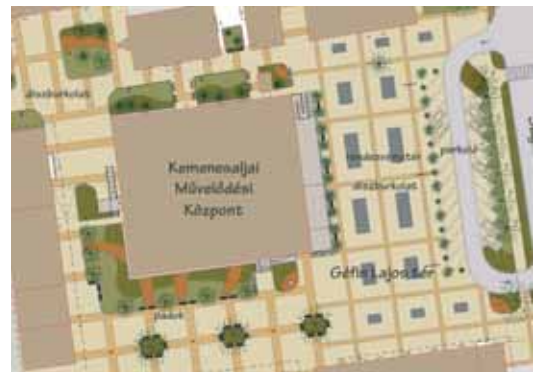
A GÉFIN TÉR AZ ELSŐK KÖZÖTT FOG MEGÚJULNI

– Régi képeslapokat, régi dokumentumokat kaptunk a várostól, hogy lássuk, milyen is volt. Ez mindig nagyon sokat segít, ha megismerhetjük, hogy egy korábbi gazdasági helyzetben milyen jellege volt az adott térnek. Amit most parknak ismerünk, hatalmas fákkal, az korábban rendezvény-, séta- illetve vásártér volt. Hasonló volt a helyzet Szombathelyen is. Ez adott bátorságot arra, hogy kiüresítsük a teret, és egy nagy sétateret alkossunk, hogy majdan az emberek töltsék meg élettel. Mind a Géfin tér, mind a Szentháromság tér tervezésénél ez volt a vezérmotívum, a Hollósy Jusztinián tér esetében pedig minél jobban megőrizni a növényi állományt – hiszen a kevesebb több. Minél kényelmesebb, kellemesebb köztereket szeretnénk létrehozni, nem szeretnénk saját elképzeléseinket ráerőltetni a városra. Fontos számunkra, hogy az emberek magukénak érezzék az új tereket, és szívesen töltsék ott idejüket.