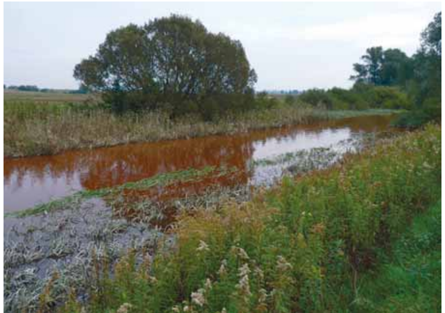
A VÖRÖSISZAP A MARCALBA IS ELJUTOTT

Mert nem mi alkotjuk Őt, hanem Ő alkotott bennünket! S nem mi rendelkezünk vele – pedig hányan mozgatnák Őt most is, mint valami marionett-figurát, hogy