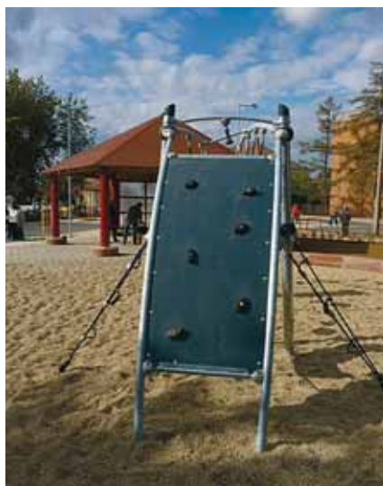
JÁTÉKELEMMEL ÉS BUSZVÁRÓVAL EGÉSZÜLT KI A DÍSZTÉR

Cellödömök Város Önkormányzatának régi szándéka volt, hogy felújítsa a Városi Általános Iskola (volt alsós Gáyer) előtti teret, az I. világháborús emlékművet és a szovjet