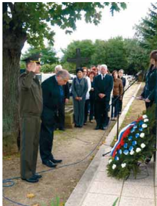
AZ OROSZ NAGYKÖVETSEGI ELSŐ TITKÁR IS JELEN VOLT AZ ÚJRATEMETÉSEN

Második elemként 2010. június 22-én a Nekro Temetkezési és Szolgáltató Kft. (Cellödömök) kezdte meg a temetői sírok feltárását és exhumálását. A katonai temető megszüntetéséhez, a maradványok exhumálásához a Honvédelmi Minisztérium Hadtörténeti Intézet és Múzeum Hadisírgondozó Irodája, illetve az illetékes akkreditált nagykövetség is hozzájárult. Marics Sándorné elmondása szerint a katonai sírokban összesen 159 katonai földi maradványt találtak meg és temették újra a köztemetőben. Az emléktábla avatását 2010. szeptember 27-én tartották, melyen jelen volt Szemidetko Vladimir , az Oroszországi Föderáció Nagykövetségének első titkára is, aki a következőket nyilatkozta: „Magyarország felszabadításában 220 ezer katonai és katonatiszt hunyt el. Az ország területén jelenleg több mint 112 ezer szovjet