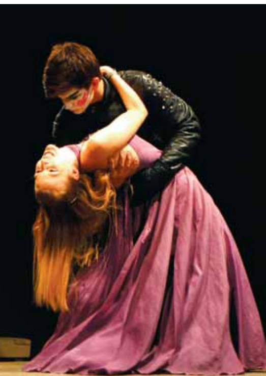
JELENET A VÉGZETES SZERELEM JÁTÉKA CÍMŰ ELŐADÁSBÓL