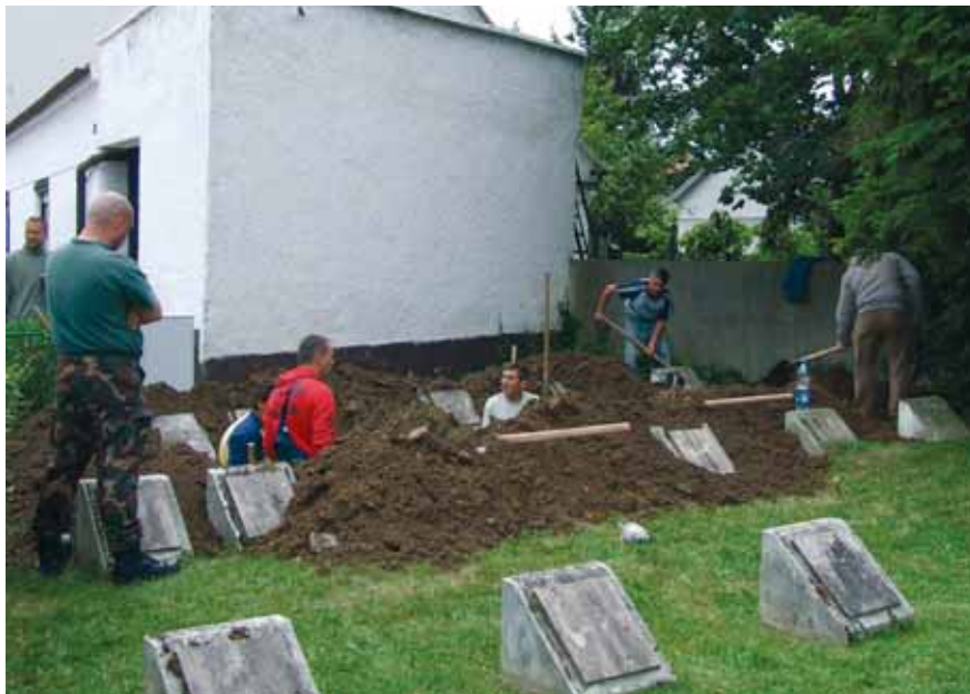
A SÍROK FELTÁRÁSÁT KÉZI MUNKAERŐVEL IS VÉGZIK

Celldömölk Város Önkormányzata régóta tervezi a város általános iskolája körüli központi, közösségi tér megújítását. A jelenlegi közlekedési állapot, az intézmény megközelíthetősége, a meglévő infrastruktúra nemcsak méltatlan a mindennap ott közlekedő, tanuló közel 1200 fős gyerekközösség számára, hanem állandó balesetveszély-forrást is jelent. Celldömölk Város Önkormányzata az Új Magyarország Fejlesztési Terv Nyugat-dunántúli Operatív Program támogatási rendszerében pályázaton nyert támogatást többek között a fentiekre is, melynek szerződését 2010. február 25-én írta alá. A közösségi tér megújítását szolgáló támogatás a következőket foglalja magában: a már említett ún. orosz temető teljes exhumálását, a feltárt maradványoknak közös helyen – a városi temetőben – történő újra temetését; az I. világháborús emlékmű teljes restaurálását; a felszabaduló területen zöldterület, park kialakítását buszváró, játszóeszköz elhelyezésével; a József Attila utca általános iskolák előtti szakaszának díszburkolattal, új utcabútorzattal való felújítását, ezen utcaszakasz sétáló utcává való alakítását; tér kialakítását a Bartók Béla utca – József Attila utca – Széchenyi István út találkozásánál; a Széchenyi úton lévő gyalogos átkelőhely áthelyezését; buszöblök