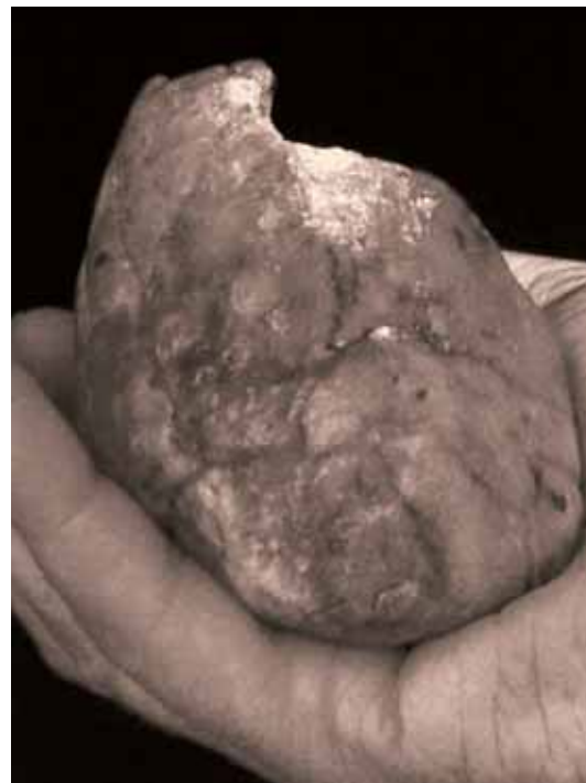
A „BESZÉDES KAVICS” ÉVEZREDEK ÜZENETÉT HORDOZTA SZÁMÁRA