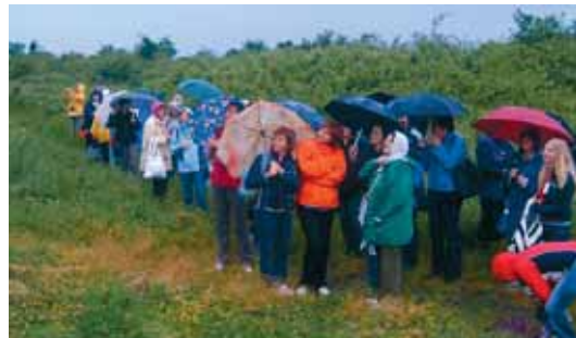
AZ ESŐBEN IS VONZÓ SÁG HEGY

A képzés szervezői gondoltak a pihenésre is. Nem maradt el a Ság hegyre szervezett ki-