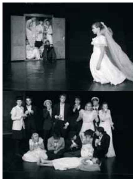
ÚJSZERŰ ÉLMÉNYEKKEL TELI DARAB AZ ÁLOMEVŐK

Az évadzáró keretében minden évben gazdára talál a „Színház erős oszlopa