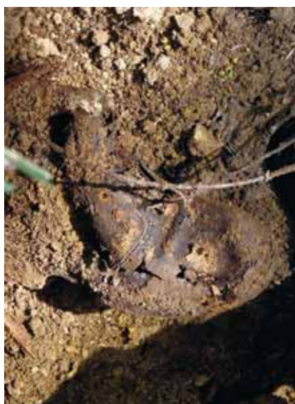
HASZNÁLATI ESZKÖZÖKET, A KÉPEN LÁTHATÓ BAKANCSOT IS TALÁLTAK A FELTÁRÁS SORÁN