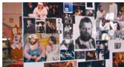
RÉSZLET A KIÁLLÍTÁS ANYAGÁBÓL