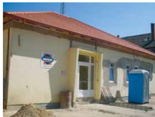
PÁLYÁZATI PÉNZBŐL ÚJULNAK MEG AZ ADY UTCAI RENDELŐK IS

hoz nagy összegű hiteleket vettünk fel, ezeket vissza is kell fizetni. A megkezdett beruházásokon kívül többet nem nagyon bír el a város. Ha a munkákat befejezzük, és sike-