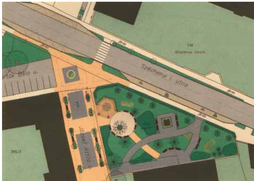
A VÁROSI ÁLTALÁNOS ISKOLA ELŐTTI TÉR LEENDÓ KIALAKÍTÁSA

keretein belül kisebb és nagyobb városok fejlesztésére összesen 12 milliárd forintot lehetett elnyerni. Celldömölk sikeresnek mondhatja magát, hiszen a kisvárosi városfejlesztést szolgáló pályázatok közül 13 pá-