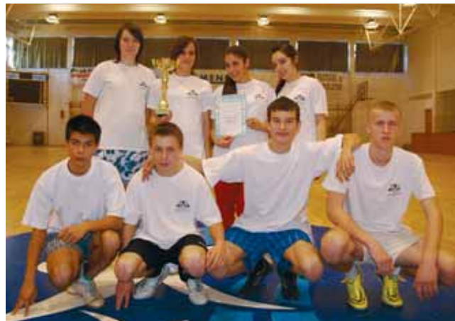
A SPORTNAP RÉSZTVEVŐI A SZAKKÖZÉPISKOLÁBAN

se a 7–8. osztályosok számára nyílt napok és bemutató órák szervezésével. A közös tanulói programok szervezése (sportversenyek, diáknapi) nemcsak nevelő értékűek, hanem megismerhetik a középiskolai életet, az ott tanító pedagógusokat. Az iskolákban felzárkóztatások és korrepetálások segítségével igyekeznek a tanulók lemorzsolódását elkerülni. Ezen tevékenységek nagy része már őszi óta folyamatosan megvalósul. Kiemelném ezek közül a szakközépiskolában rendezett sportnapot, ahol változatos versenyek, tánc és torna-bemutató emelték az esemény színvonalát. A szakmai óralátogatásokon nagy élményt jelentett a 7–8. osztályos tanulóknak az esztergaper működésének, valamint az interaktív tábla használatának bemutatása.