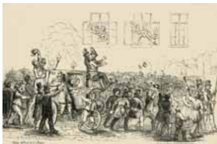
TÁNCSCICS MIHÁLY KISZABADÍTÁSA A BÖRTÖNBŐL

Reggel a kávéházban elhatározták, hogy sora járják az egyetemi ifjúságot – orvosi kar, mérnökök, jogászok – Jókai mindenütt felolvasa a 12 pontot, Petőfi elszavalta a Nemzeti dalt. A refrént a tömeg, mely egyre nőtt, együtt harsogta: „esküszünk!”. Már ötezren