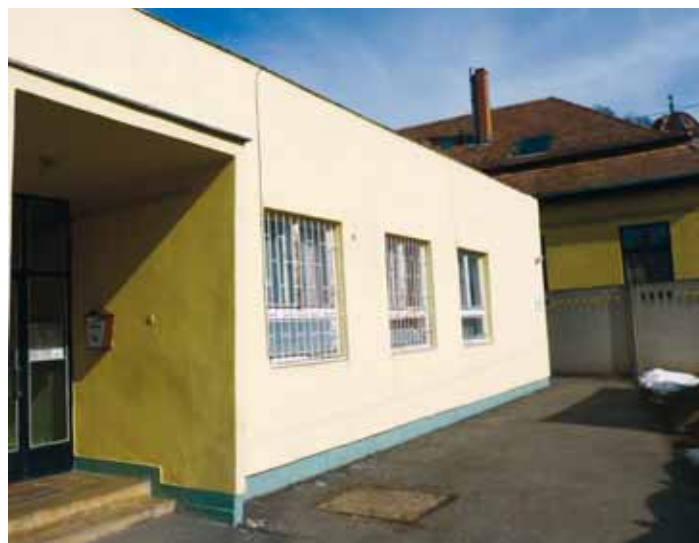
AZ ADY UTCAI RENDELŐK ÉPÜLETE MA

– 2008-ban írták ki az egészségügyi ellátás járóbeteg-szakellátása fejlesztését célzó pályázatot, a Nyugat-dunántúli Regionális Operatív Program keretében, melyre mi az Ady utcai rendelő épületének felújításával pályáztunk. Projektünket 2008. július 15-én fogadták be, és 2009 júniusában kaptuk az értesítést a támo-