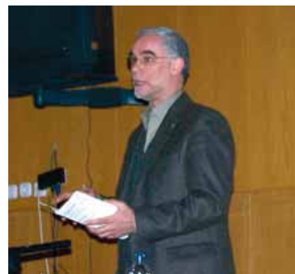
»AZ OLDALT ÖSSZEÁLLÍTOTTA: LOSONCZ ANDREA

zetett. A magyar lakosság egyharmada rosszabbul él, mint a Kádár-rendszer alatt. Beszélt az oktatási rendszer válságáról is: hiányolja az oktatásból az etikát, hiszen a környező államok mindegyikébe be van építve a tananyagba. Majd a közbiztonság válsága került szóba. A legsúlyosabbnak mégis a lelki válságot tartja. Mindegyik válság mélyén az van, hogy az adott rendszer mit gondol az emberről. A kiutat Balog Zoltán a nemzeti radikalizmusban látja. A közjónak és a magán boldogulásnak a harmóniáját kell megteremteni, és ezt csak nemzeti keretben tudja elképzelni.