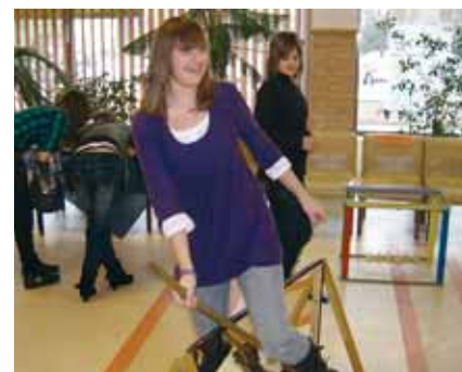
A TANULÓK KIPRÓBÁLHATTÁK A SEPRŰNYÉLEN VALÓ „REPŰLÉST” IS