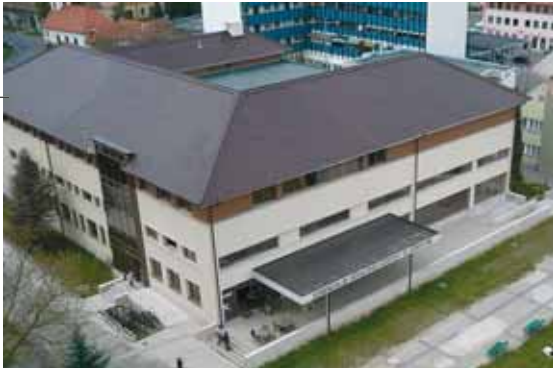
A MŰVELŐDÉSI KÖZPONT LÁTKÉPE MA

té választást. A Kemenesaljai Művelődési Központban népművelőként, majd vezetőként is a városomért végzett szolgálatot tartottam és tartom most is a legfontosabbnak.