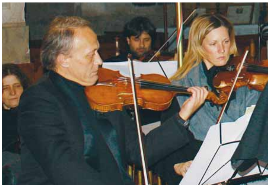
A SAVARIA SZIMFÓNIKUS ZENEKAR BENSŐSÉGES KARÁCSONYI HANGULATOT TEREMTETT

(kültéri csúszda), Alsósági tagóvoda (játékeszközök) támogatása jellemezte tevékenységünket. Programjainkhoz mindig csatlakoztak szülők, vállalkozók, akik nélkül természetesen nem könyvelhetnénk el magunk mögött ilyen tevékeny évet. Az Adventi készülődés jellegéből adódóan egy új kezdeményezés Celldömölkön. Nagyon örülök, hogy rendezvé-