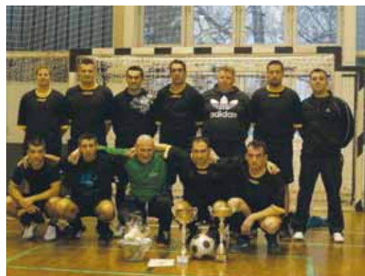
A BAJNOKOK TORNÁJÁN GYŐZTES CSAPAT

Öt éve a VulkánSport Egyesület kezdeményezésére január első felében megmériköznek