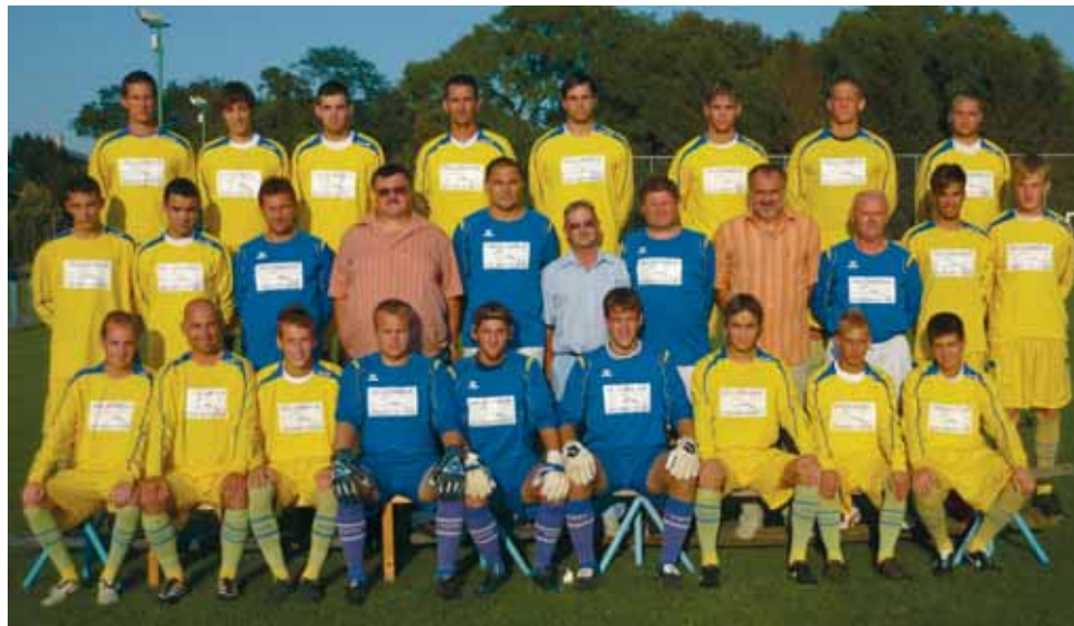
A CVSE FELNÖTT LABDARÚGÓ CSAPATA

kal együttvéve sem haladhatja meg a létszám a következő szezonban a 90 csapatot. Így valószínűleg az utolsó három helyezeten kívül a négy legrosszabb 11. helyezett is búcsúzhat júniusban a harmadosztály mezejétől, persze abban az esetben, ha pl. minden megyei bajnok vállalja a feljebb lépést és persze, ha az MLSZ kitart az eredeti kiírása mellett. Mindenesetre nem ezekre az esetlegességekre kellene bízni a dolgot, hanem saját kézben kellene tartani a történetet, mondjuk úgy, hogy dupla annyi pontot gyűjtünk, mint ősszel, a harminc pont