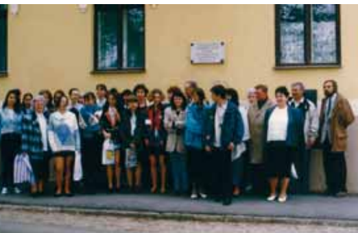
A KRESZNERICS-VERSENY RÉSZTVEVŐI 1996-BAN

szolgáltatások, a helyi művelődéstörténeti hagyományokra épülő programok, a könyvtárosok kiemelkedő szakmai teljesítménye által azonosítható lett intézményünk a közkönyvtárak között.