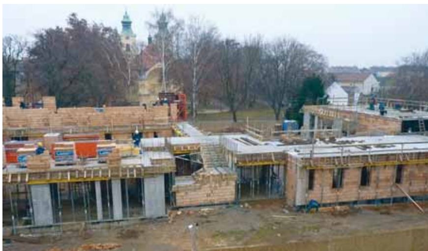
GYORS ÜTEMENBEN ÉPÜL AZ ÚJ VÁROSHÁZA, A KIVITELEZŐ MÁJUS VÉGÉRE ÍGÉRTE A BEFEJÉZÉST

– A Vulkán Gyógy- és Élményfürdőnek augusztusban ünnepeltük a 4 éves évfordulóját. Amikor átadtuk, tudtuk, hogy egy ilyen szolgáltatás folyamatos fejlesztést igényel. Nagyon pozitívnak találok a gyógyászati részleg beindítását, hiszen azóta mintegy 20 ezer fővel növekedett a vendégforgalom.