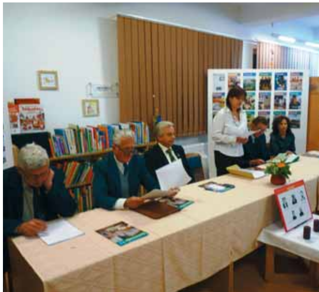
AZ ELŐADÓK TÖBB SZEMPONTBÓL MUTATTÁK BE A LAPOT